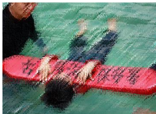
【水難事故防止教室】