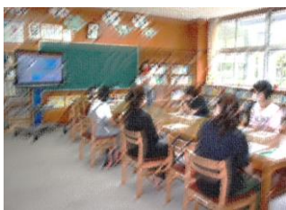
【南澤先生による講話】