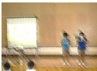
【授業参観(表現発表会)】