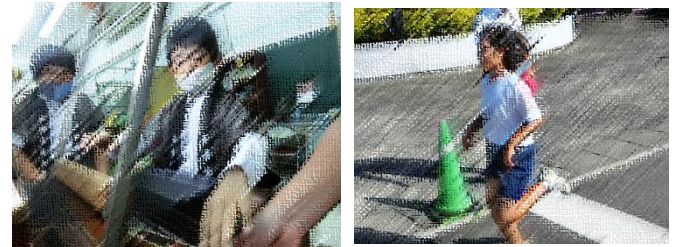
【村合同社会科見学】